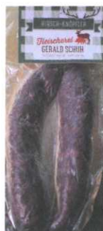
Hirschknöpfler 2 Stk. € 5,00