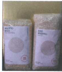
Risotto Basismischung 250g € 6,00