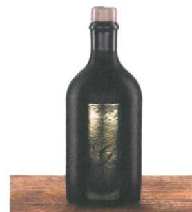
Gin 0,5l € 30