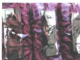
Blaufränkisch Nudeln 200g € 2,2 400g € 4,40