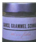
Gansl Grammelschmalz 90g € 8,10