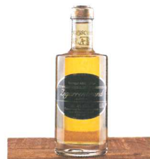
Zigarrenbrand 0,35 € 35,00