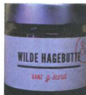
Wilde Hagebutte 110g € 8,90