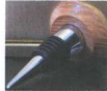
Flaschenverschluss € 25