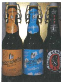
Kobersdorfer Schlossbräu versch. Sorten 0,33l € 3,00