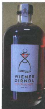
Dirndllikör 0,5l € 20,00