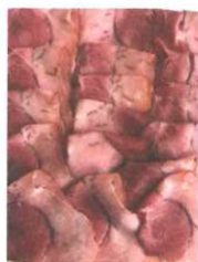
Blaufränkisch Schinken 10dag € 2,50