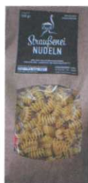
Straussenei Nudeln 250g € 3,50