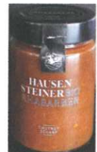
Rhabarber oder Marillen Chutney 200g € 5,50