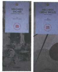
Milchreis Sacher oder Creme Brûlée 250g € 6,00