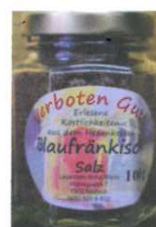
Blaufränkisch Salz 100g € 4,00