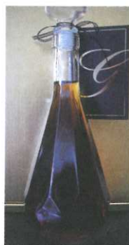
Aurum 5jähriger Weinbrand 0,5l € 55