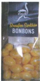
Straußeneierlikör Zuckerl 150g € 4,00