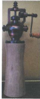
Peppermühle antik € 55,00