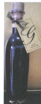
Rotwein Balsamessig 250ml € 12