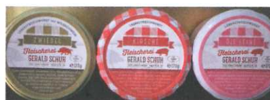
Wildschwein Leberpasteten versch. Sorten 200g € 5,80