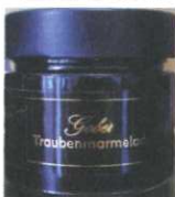
hausgemachte Traubenmarmelade 200g € 3,90