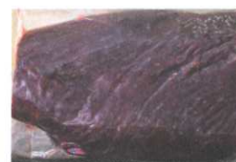
Straussenschinken 10dag € 6,00

nicht jederzeit erhältlich (keine Abbildung vorhanden)