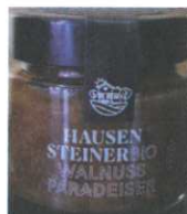
Walnuss Paradeiser Pesto 100g € 6,00