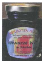
Schwarze Nüsse 100g € 5,00