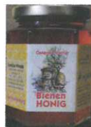
Kastanienhonig 250g € 5,00