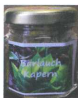
Bärlauchkapern 50ml € 3,50