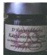
Kastanien Chutney 125g € 3,50