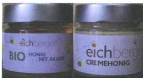
BIO Creme oder Akazien Honig 250g € 4,50