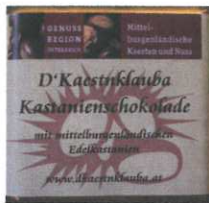
Kastanienschokolade 60g € 3,70