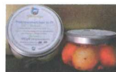
Ziegenfrischkäse Bällchen in Öl - versch. Sorten 160g € 4,50