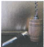
Bottle opener/Wine press 2 in 1 Weinfass € 45