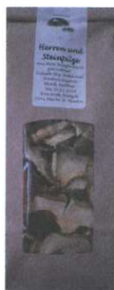
Steinpilze getrocknet 150g € 4,50