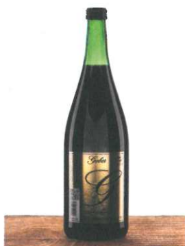
Traubensaft 1l € 2,80