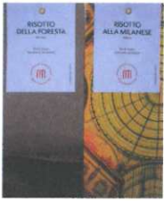
Risotto versch. Sorten 250g € 6,00