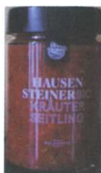
Kräuterseitling Bolognese 250g € 6,00