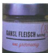
Gansl Fleisch Aufstrich 90g € 8,90