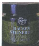
Hanfsamen Pesto 100g € 6,50