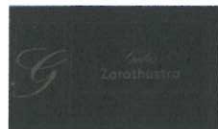
Zarathustra Rotweinschoko 90g € 4,00