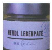
Hendl Leberpate 90g € 7,50